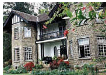
Norbert Schnorbach Greystone-Villa in Diyatalawa

Und wer sehen möchte, wie Sandelholz, Knoblauch, Nelken und Hunderte von Kräutern und Heilpflanzen zu Medikamenten verarbeitet werden, darf sich in der Arzneimittelfirma umschaun. Dort köchelt Öl in großen Bottichen. In einem Dutzend großer Teakholz-Fässer reift einen Monat lang ein Likör-ähnliches Kräuterelixier. Das Vorratslager ist eine Duft-Orgie für die Nase. "Wir haben 240 Pflanzenstoffe auf Lager", erzählt Vindyani Hettigoda, die Enkelin des Firmengründers. "Allein für das Rezept des Kräuterweins Dasamularishta, den auch die Gäste im Hotel erhalten, braucht man 84 Pflanzen."